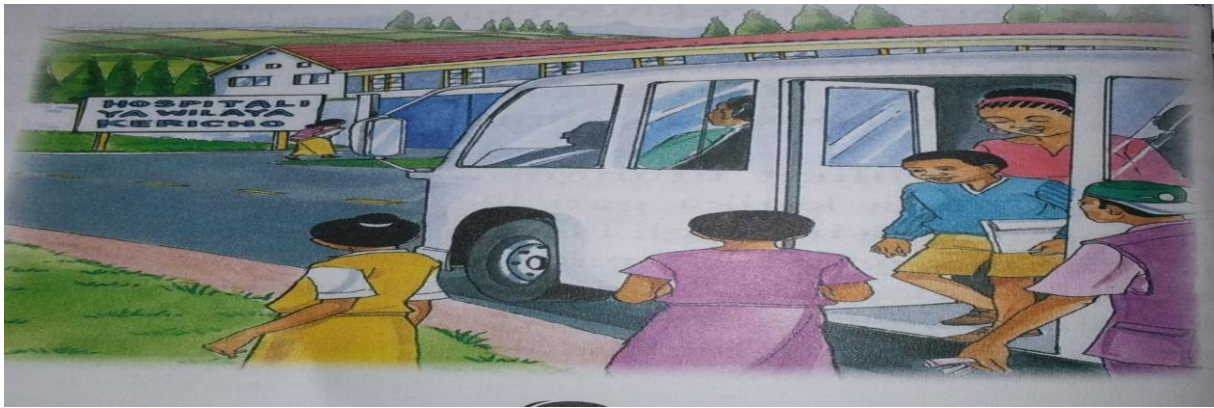
Picha 1: Utingo Katika Ukurasa 30— Sitaki Iwe Siri

Baada ya maelezo haya mwandishi ametuwekea picha katika ukurasa huo inayoonesha abiria wakishuka kutoka kwenye gari. Katika picha hii pia kuna kondakta au utingo ambaye anafafanuliwa katika tashbihi tuliyotaja. Ni wazi kuwa lengo la picha hii ni kusisitiza maelezo haya.