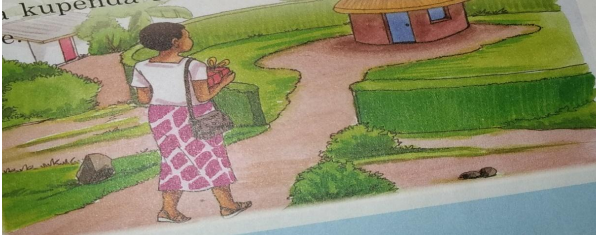
Picha 8: Chaurembo Akilelekea Katika Nyumba Yake Mpya Katika Ukurasa 31-- Nimefufuka