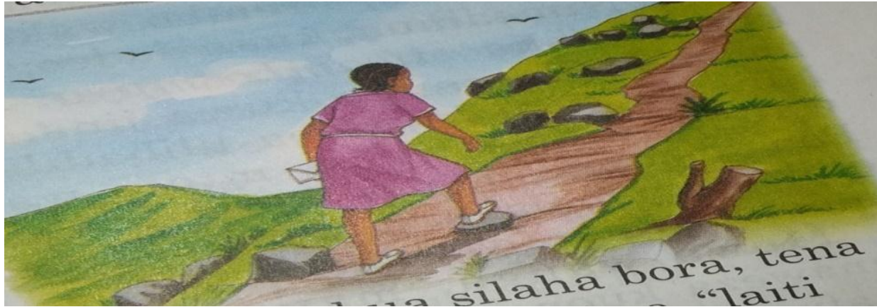
Picha 4: Mkwaa Mlima Katika Ukurasa 17— Nimefufuka