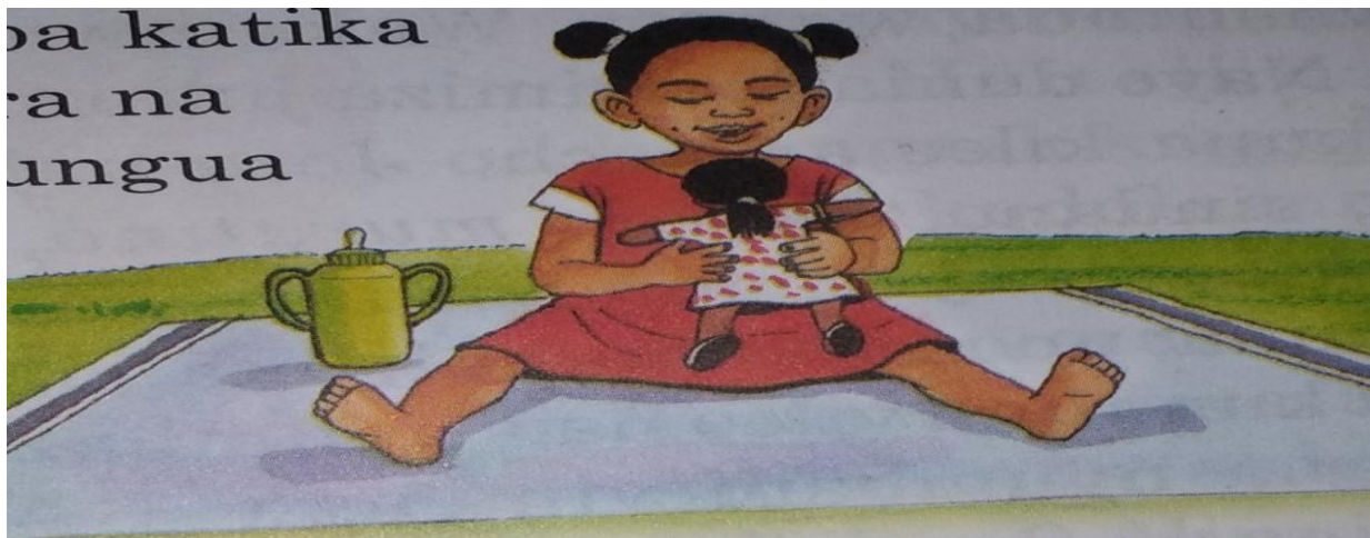
Picha 10: Mtoto Tabu Akicheza na Mwanasesere Wake Katika Ukurasa wa 12— Nimefufuka

Kisha kuna picha inayodhihirisha hili katika ukurasa wa 13.