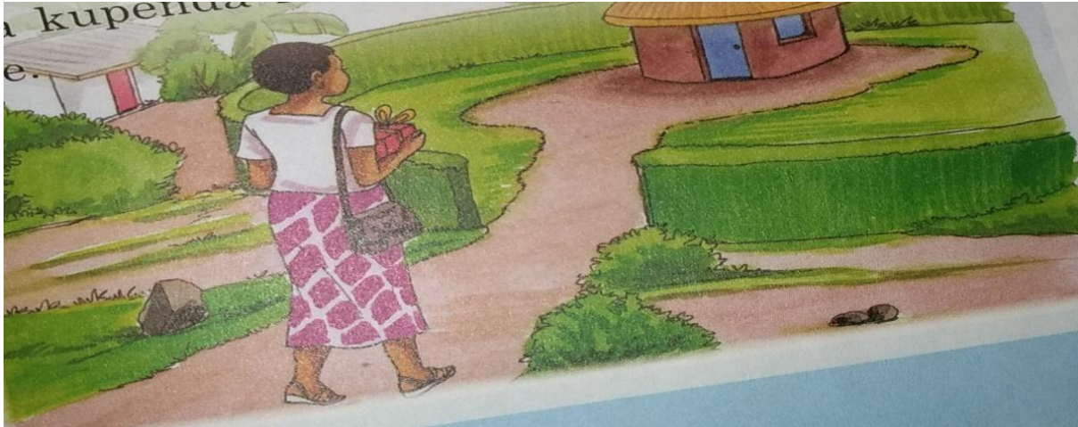
Picha 8: Chaurembo Akilelekea Katika Nyumba Yake Mpya Katika Ukurasa 31-- Nimefufuka